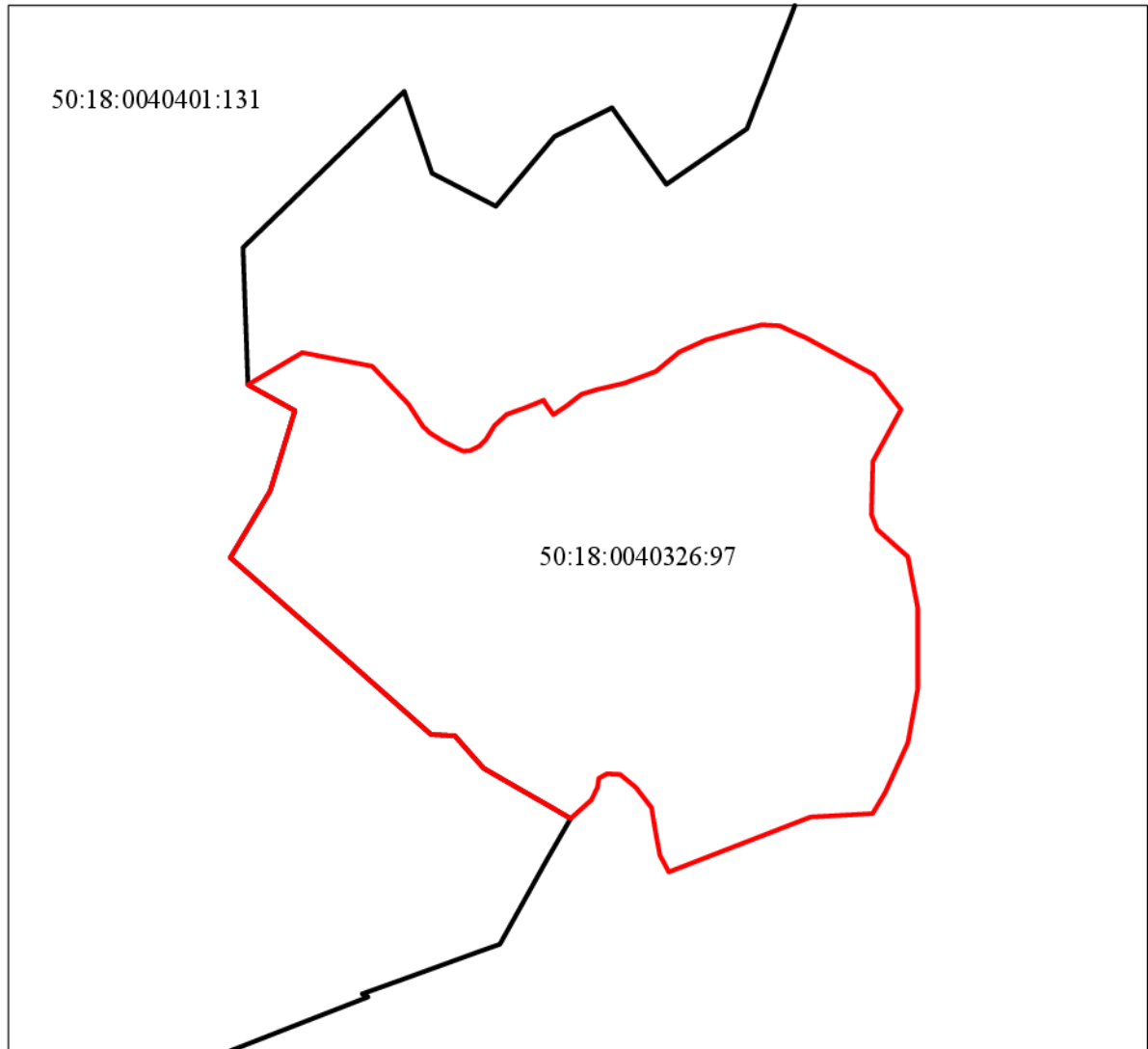
Схема расположения земельного участка в окружении смежно расположенных земельных участков (Ситуационный план)